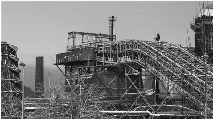
Blick auf den Erzschrägaufzug des Weltkulturerbes Völklinger Hütte

Mit der neuen Großausstellung JULIAN ROSEFELDT. WHEN WE ARE GONE bietet das Weltkulturerbe Völklinger Hütte ein inspirierendes Gesamtkunstwerk aus Film, Tanz, Text und Musik, das ein intensives Kulturerlebnis mit mannigfaltigen Denkanstößen verbindet. In den Weihnachtsferien starten die ersten Führungen zur Schau, die das Zusammenspiel der sieben zum Teil monumentalen Werke mit den eigens ausgewählten Orten in und unter der Gebläsehalle vorstellen. Die gedankliche Bandbreite reicht von der treibenden Kraft der Industrialisierung – dem Kapitalismus – bis hin zu den Auswirkungen unseres Zeitalters, in dem der Mensch durch Technik den Erdball massiv verändert hat. Drummer geben den Takt vor, ein Chor singt und in den Katakomben der Gebläsehalle tauschen Gangster in Endlosschleife ihre Geldkoffer aus.