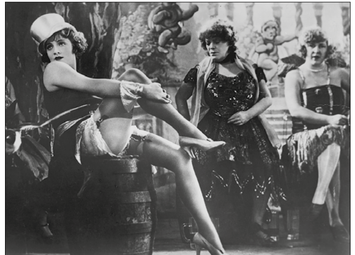
Marlene Dietrich in „Der blaue Engel“ 1930

Das saarländische Wirtschaftsministerium fördert diese ambitionierte Ausstellung in Zusammenarbeit mit der Deutschen Kinemathek – Museum für Film und Fernsehen, Berlin maßgeblich als kulturelles Leuchtturmprojekt des Saarlandes.